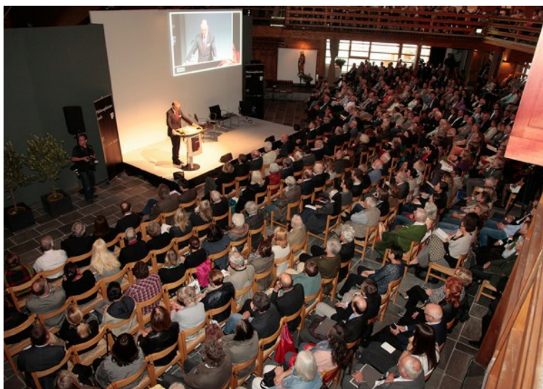
Eröffnung: 18. Philosophicum in Lech

Lech. Mit der feierlichen Eröffnung des 18. Philosophicum präsentiert sich Lech am Arlberg wieder für vier Tage als Zentrum intellektueller Auseinandersetzung.