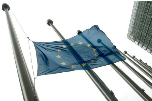
EU-Kommission: Das Bündnis Stop TTIP erfüllt nicht die Voraussetzungen für eine Europäische Bürgerinitiative