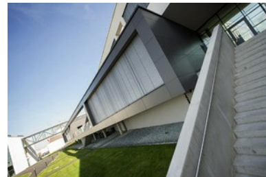
Rundgang durch "modernste Kaserne Europas"