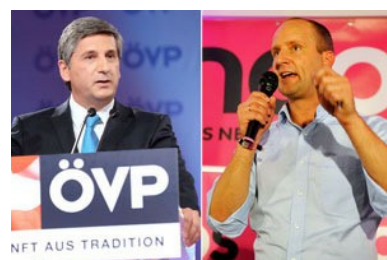
Wie Pinke und Schwarze um Bürgerliche buhlen

Anfragen für weitere Nutzungsrechte an den Verlag