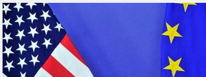
Kritik an Freihandelsabkommen mit USA wächst

Attac, das Netzwerk Seattle to Brussels und die belgische Allianz D19 20 bereiten für Donnerstag eine Demonstration vor der EU-Kommission vor. "TTIP würde die gesellschaftlichen Gestaltungsmöglichkeiten massiv einschränken und einen radikalen Angriff auf soziale, ökologische, rechtliche und demokratische Standards in der EU und in den USA bedeuten", kritisierte Suß. Die EU-Kommission war am Montag mit Unterhändlern aus den USA in die vierte Runde der TTIP-Verhandlungen gestartet.