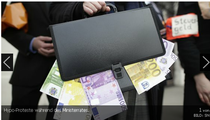
Hypo-Proteste während des Ministerrates; 1. von BILD: SN

Mehrere Regierungsmitglieder haben sich am Dienstag vor dem Ministerrat gegen einen U-Ausschuss im Parlament zur Hypo Alpe Adria Bank ausgesprochen. Die ganze Energie solle zur Problemlösung verwendet werden.