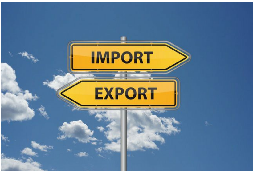
Ungebremster Warenaustausch ist eines der Ziele des TTIP.

■ Aktuelles Buch über die transatlantische Industriepolitik ohne Bürgerbeteiligung.