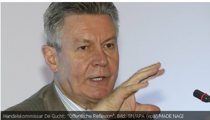
Handelskommissar De Gucht: "Öffentliche Reflexion".

Bei den Verhandlungen um das umstrittene Freihandelsabkommen zwischen der Europäischen Union und den USA (TTIP) lenkt die EU-Kommission offenbar ein.